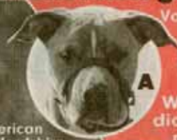
American Staffordshire „Sparky“ (4)