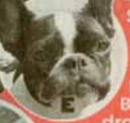
Französische Bulldogge „Spoon“ (1)