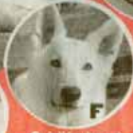
Schäferhund „Keona“ (2)