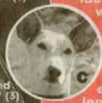
Windhund „Jill“ (5)