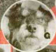
Jagdterrier „Bianco“ (4)

Von CAROLIN FRANKE und MAIKE GLOCKNER (Fotos)