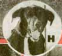
Labrador-Mix „Berry“ (3)