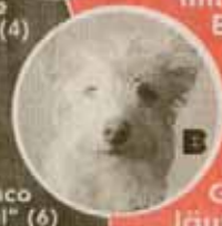
Podenco „Krümel“ (6)